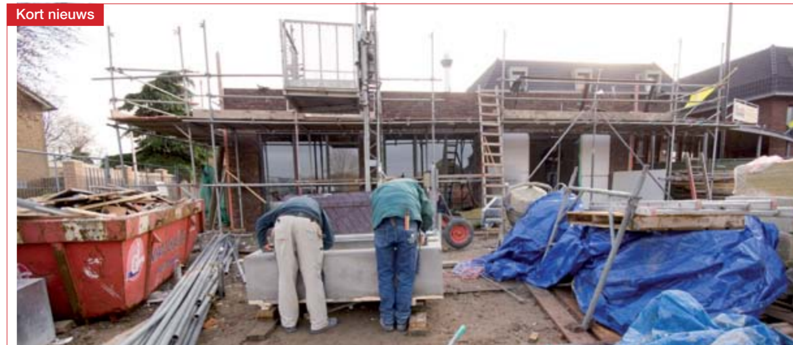
Winkel in aanbouw, Afferden