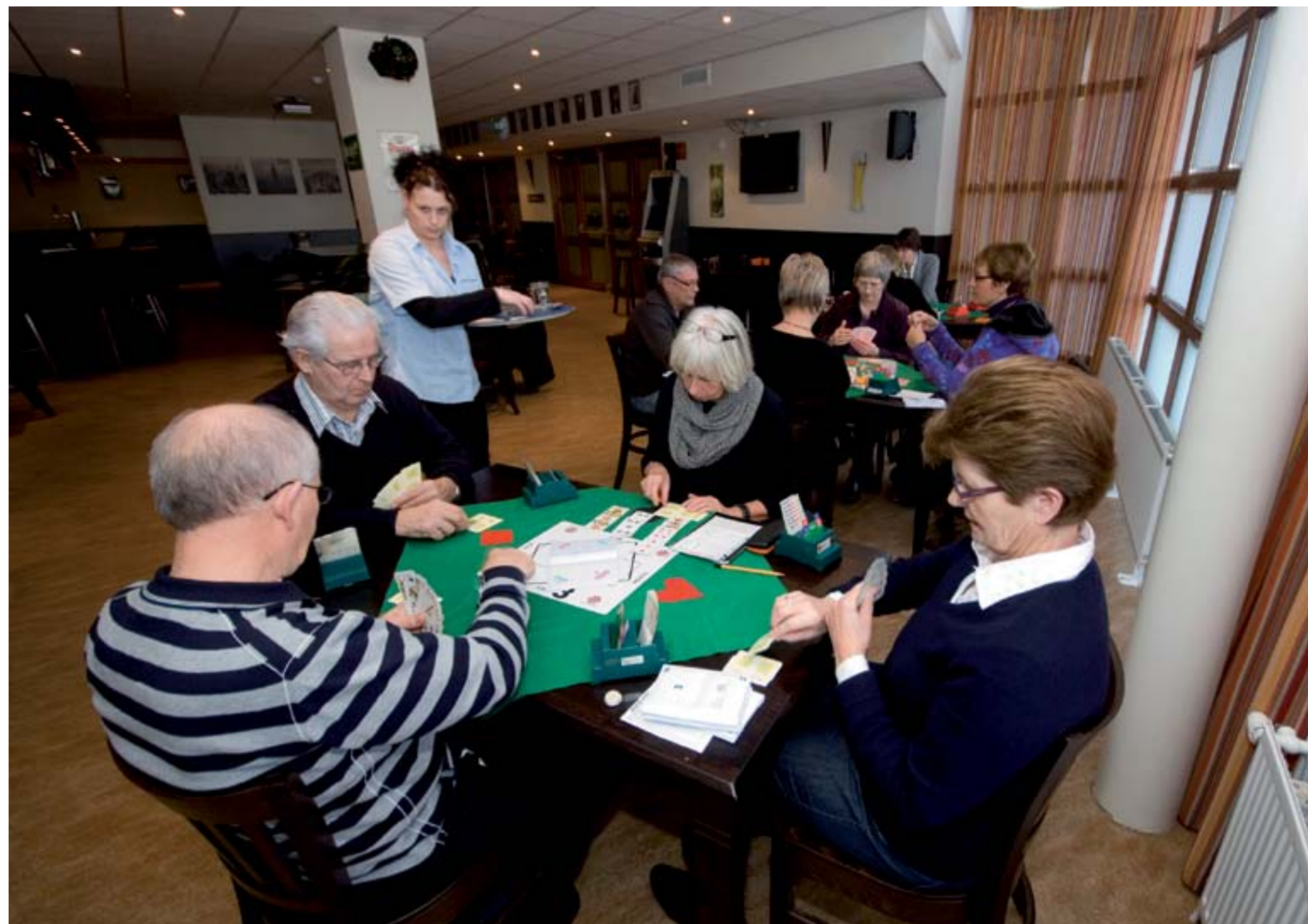
Kaarten in het Kulturhus