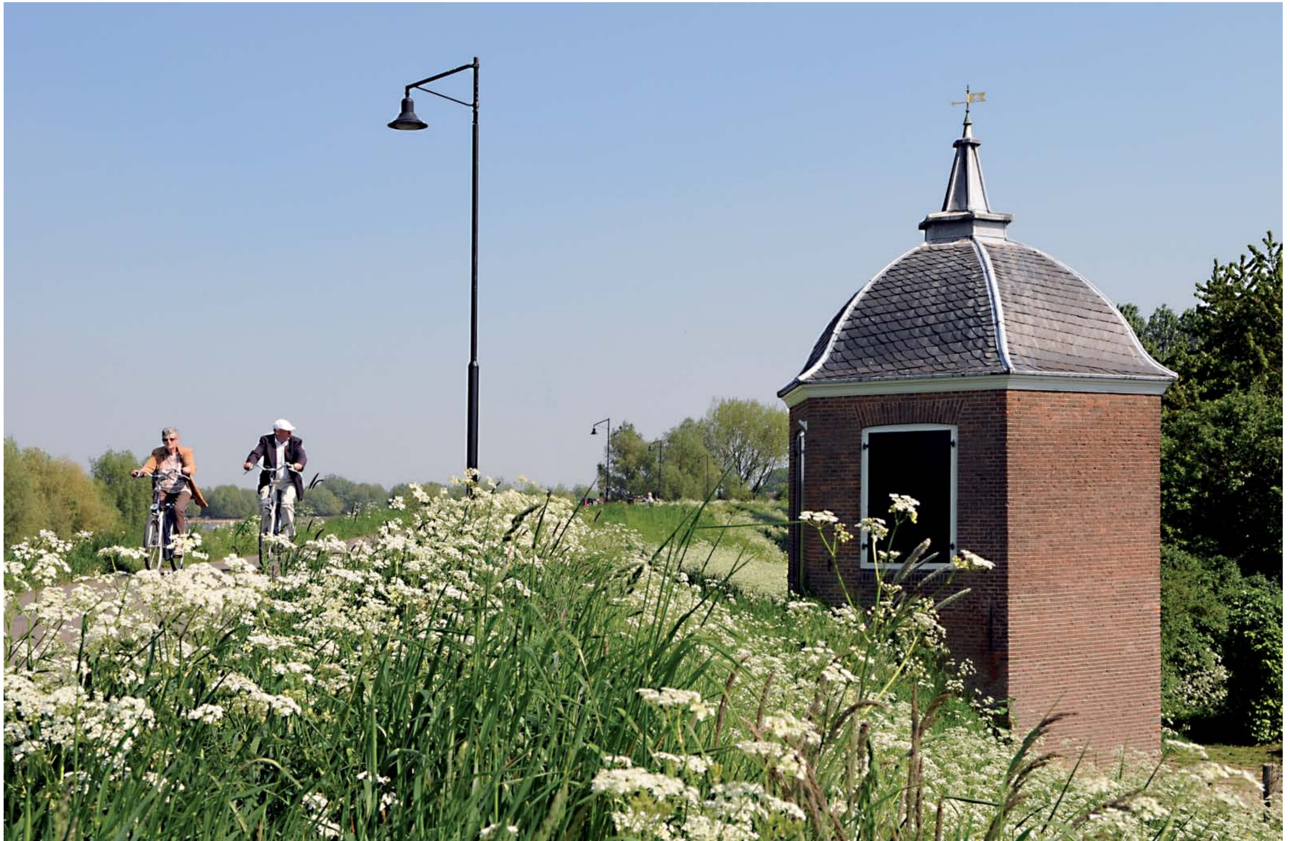
Het theekeopeltje aan de Waalbandijk in Druten.