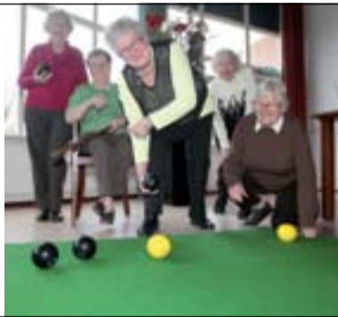
Smeerolie voor leefbaarheid > Maas en Waal: p.9