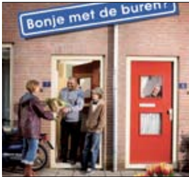
Buurtbemiddeling Beuningen en Druten > Leefbaarheid: p.3