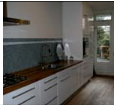
Keuzevrijheid en maatwerk Lifestyle: p.8 <